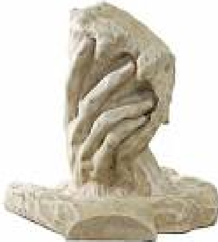
[‘De hand van God’ van Auguste Rodin, 1840-1917]